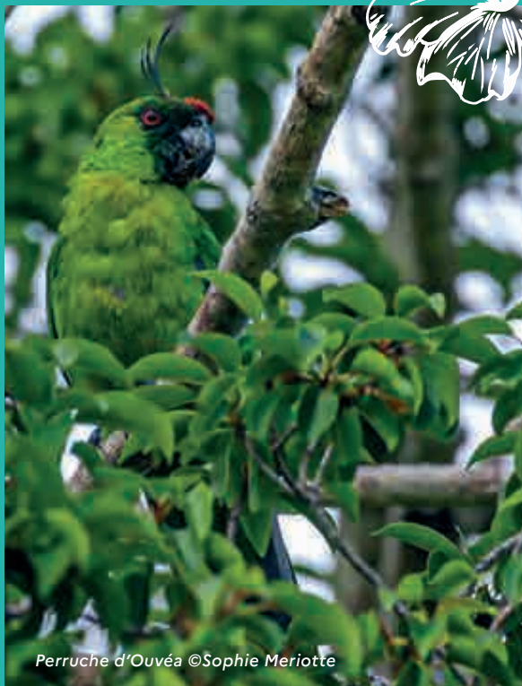
Perruche d'Ouvéa