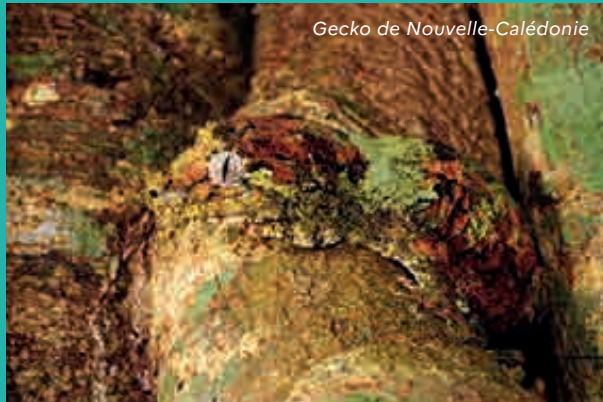
Gecko de Nouvelle-Calédonie

L'endémisme favorisé par l'isolement insulaire et la richesse du patrimoine naturel de la Nouvelle-Calédonie doivent être préservés. C'est pourquoi plusieurs espèces que vous pouvez rencontrer sur le territoire sont protégées.