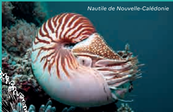
Nautilus de Nouvelle-Calédonie